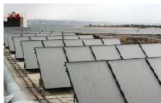
Instalação de 80 colectores solares térmicos para aquecimento de águas sanitárias Centro de estagio do Benfca