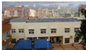
Instalação de 54 colectores solares térmicos para aquecimento de águas sanitárias IPSS em Setúbal