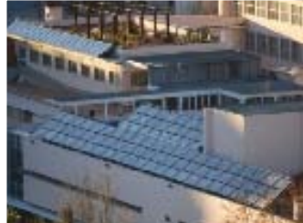
Instalação de 132 colectores solares térmicos para aquecimento de piscina e águas sanitárias Colégio São João de Brito em Lisboa