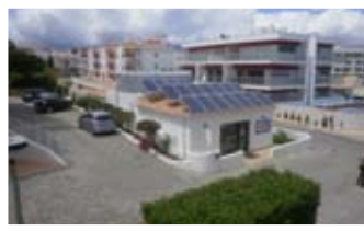
Instalação de Microgeração 3,68kW Apartamentos do Parque - Albufeira